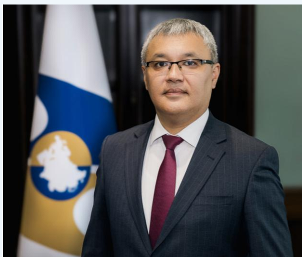
イマナリエフ・ダニール・シャルシェンベコビッチ氏

立命館大学大学院経済学研究科、2012年修了、ユーラシア経済委員会(EEC) 統合・マクロ経済担当大臣