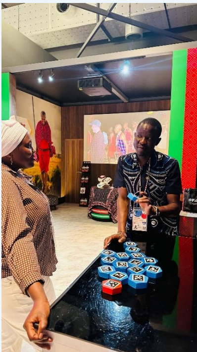
ケニア・パビリオンにて

私の主な業務は、パビリオン運営の監督や、会場で開催される各種イベントの企画・実施サポート、来場者が安全かつ学びのある魅力的な体験を得られるよう環境を整えること、さらにはケニアの製品や文化遺産の紹介・宣伝など、多岐にわたりました。