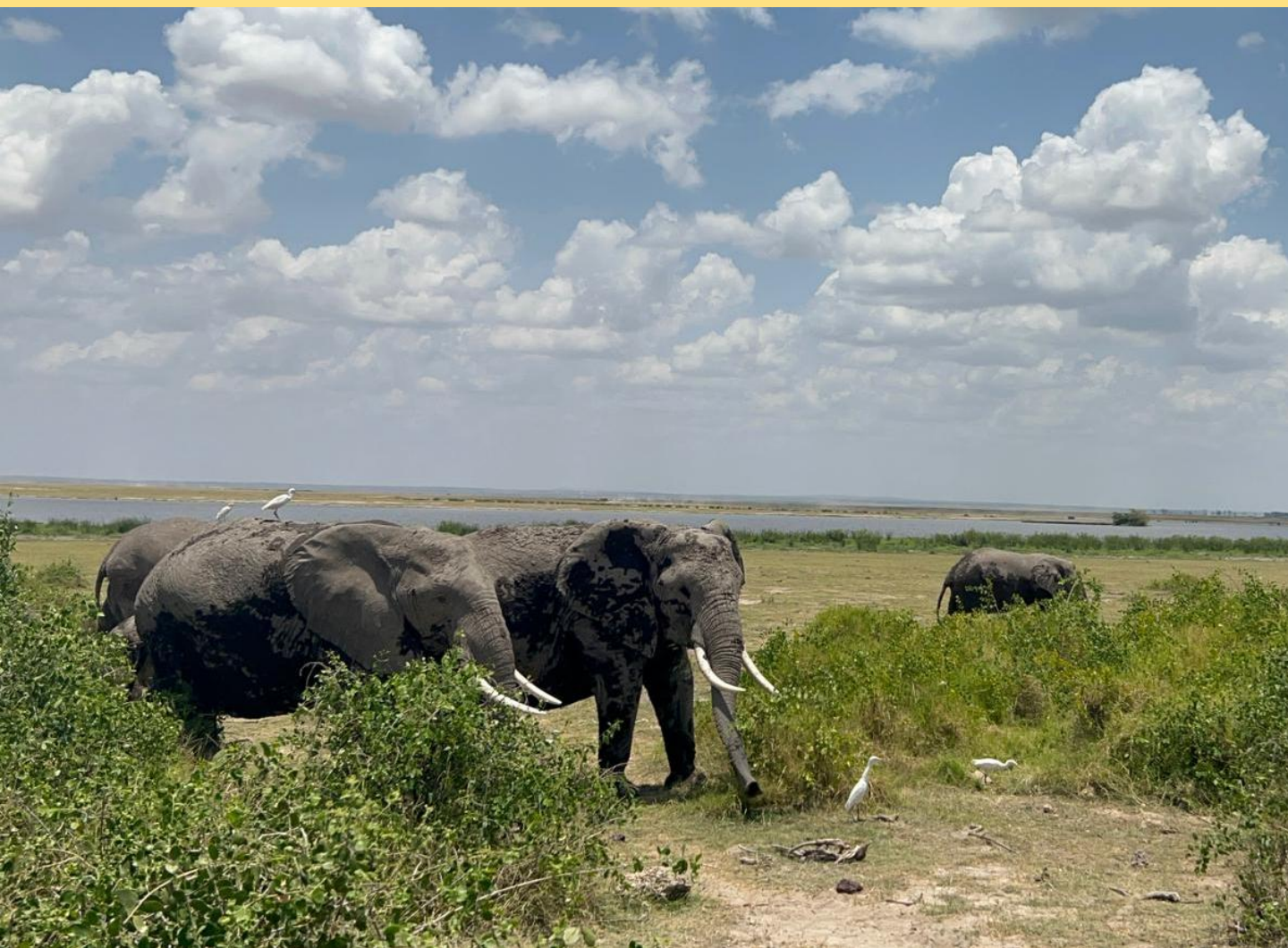
表紙：ケニアの風景