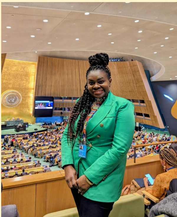
ニューヨークの国連本部会議場にて

CSW69へ参加することは私自身の目標の一つだったので、目標を達成する機会となりました。私は今年9月にGRIPSの修士課程を修了しましたが、修士課程では、「ケニアにおける10代の妊娠が女子学生の学業成績に与える影響」についての研究をしました。CSW69への参加を通じて、自身の研究をジェンダー平等に関する国際的な政策対話と結びつけることができました。また、10代の妊娠やジェンダー不平等といった世界的な課題に取り組むうえで、研究・協力・共通のコミットメントの重要性を改めて認識する機会となりました。