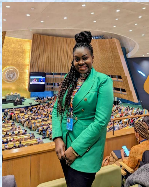
В конференц-зале штаб-квартиры ООН в Нью-Йорке