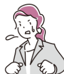
たいおう トラブルに対応する