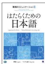
しゅうろう とっか 就労に特化したテキスト