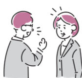
かんけつ ほうこく 簡潔に報告する