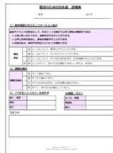
しゅうりょうしゅう ひょうかひょう 修了証※1、評価表※2

※1 80%以上の出席が必要です ※2 あなたの日本語のレベルを、講師がチェックします