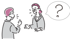
しじ ふめいてん かくにん 指示の不明点を確認する