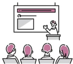
たいめん ていねい しどう 対面による丁寧な指導

さまざまなビジネス場面に応じた表現、企業文化や制度など「はたらくための知識」についても学びます