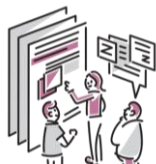
げんじょう もんだい かいぜん かんが 現状の問題の改善を考える